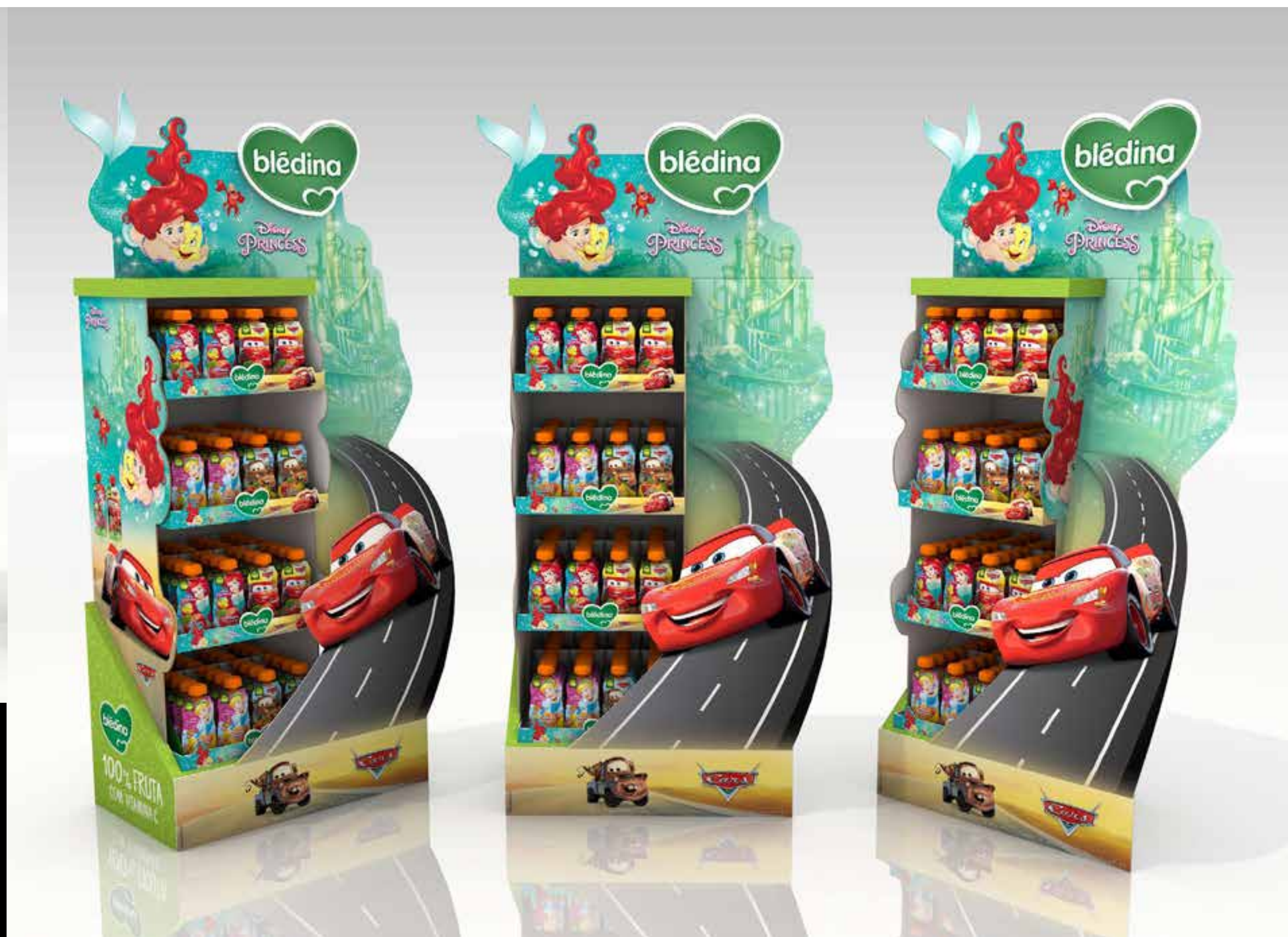
PROJETO Feira do Bebê Blédina Disney _Exposito e Ilha