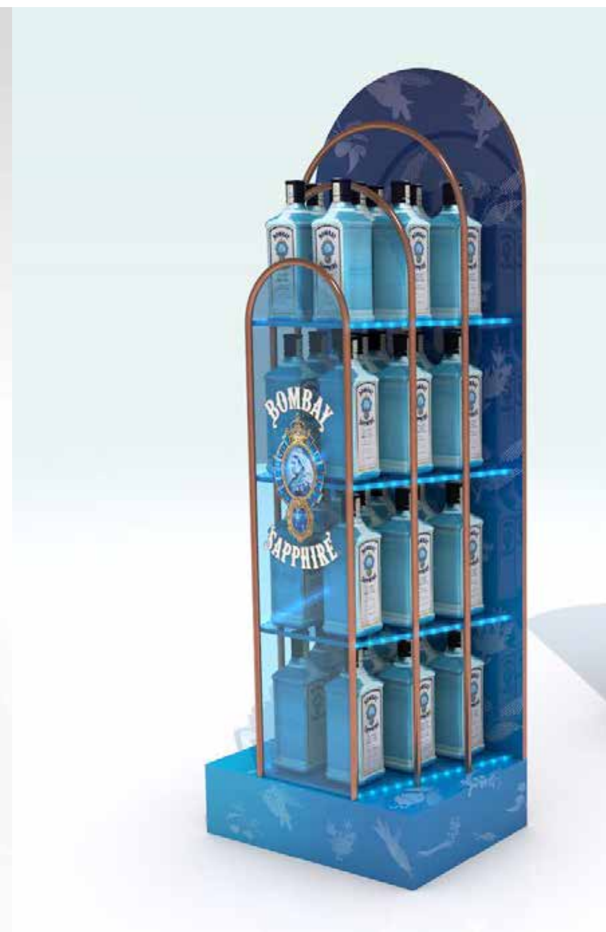
PROJETO Expositores Vários