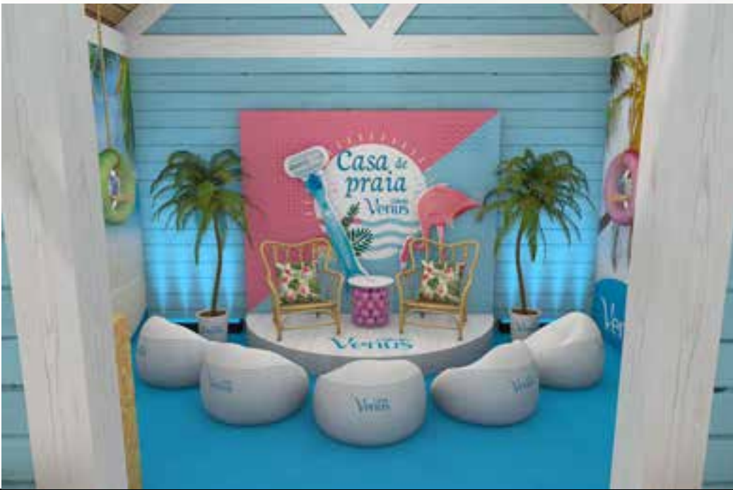
PROJETO Gillette Venus Casa de Praia