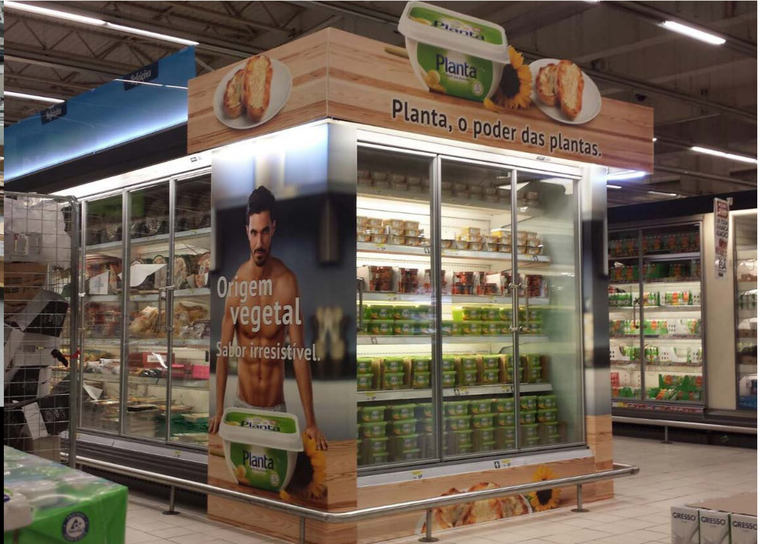
PROJETO Expositor Eristoff e Topo de Frio Planta