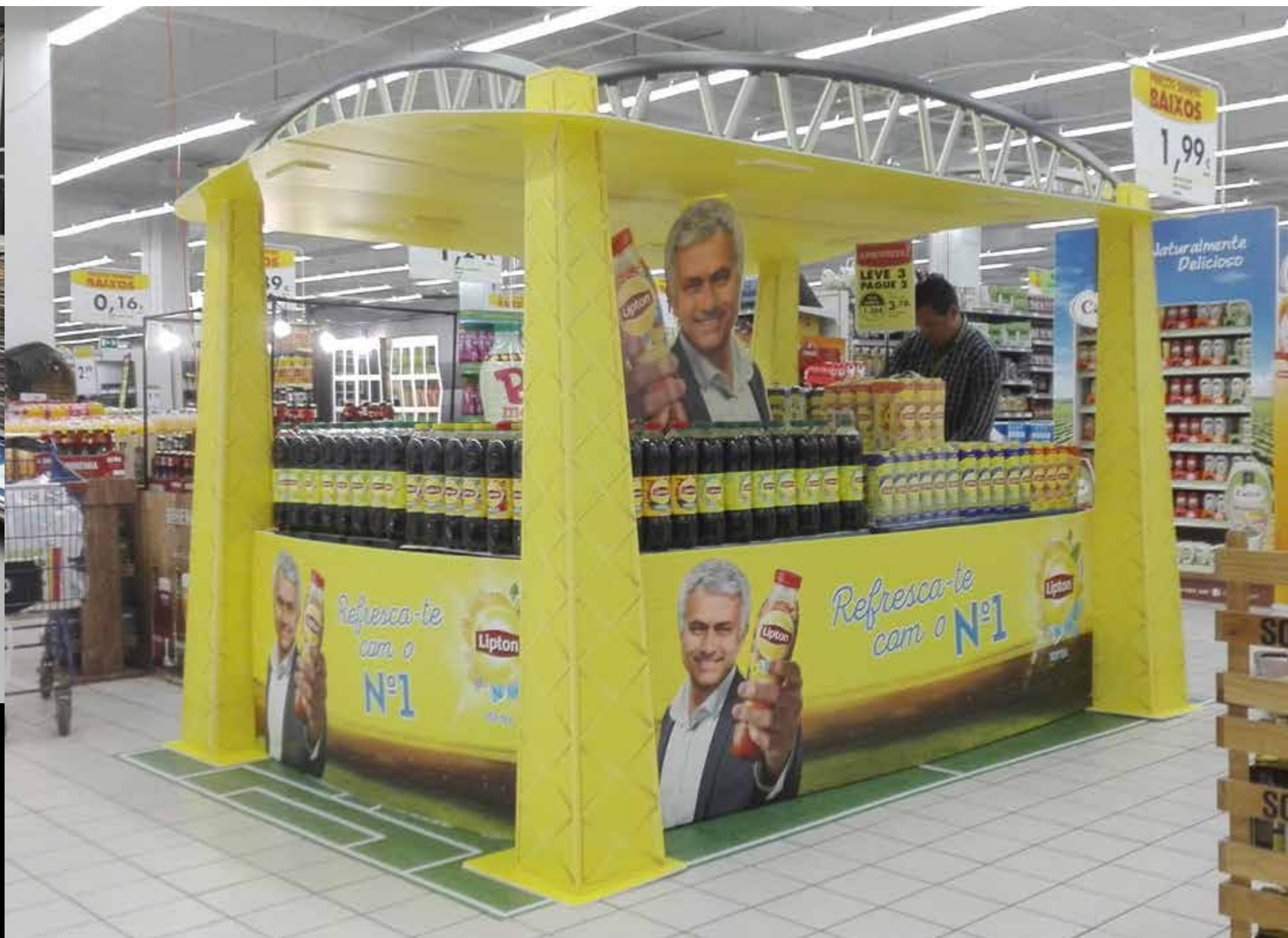
PROJETO Expositor Calgon e Ilha Lipton