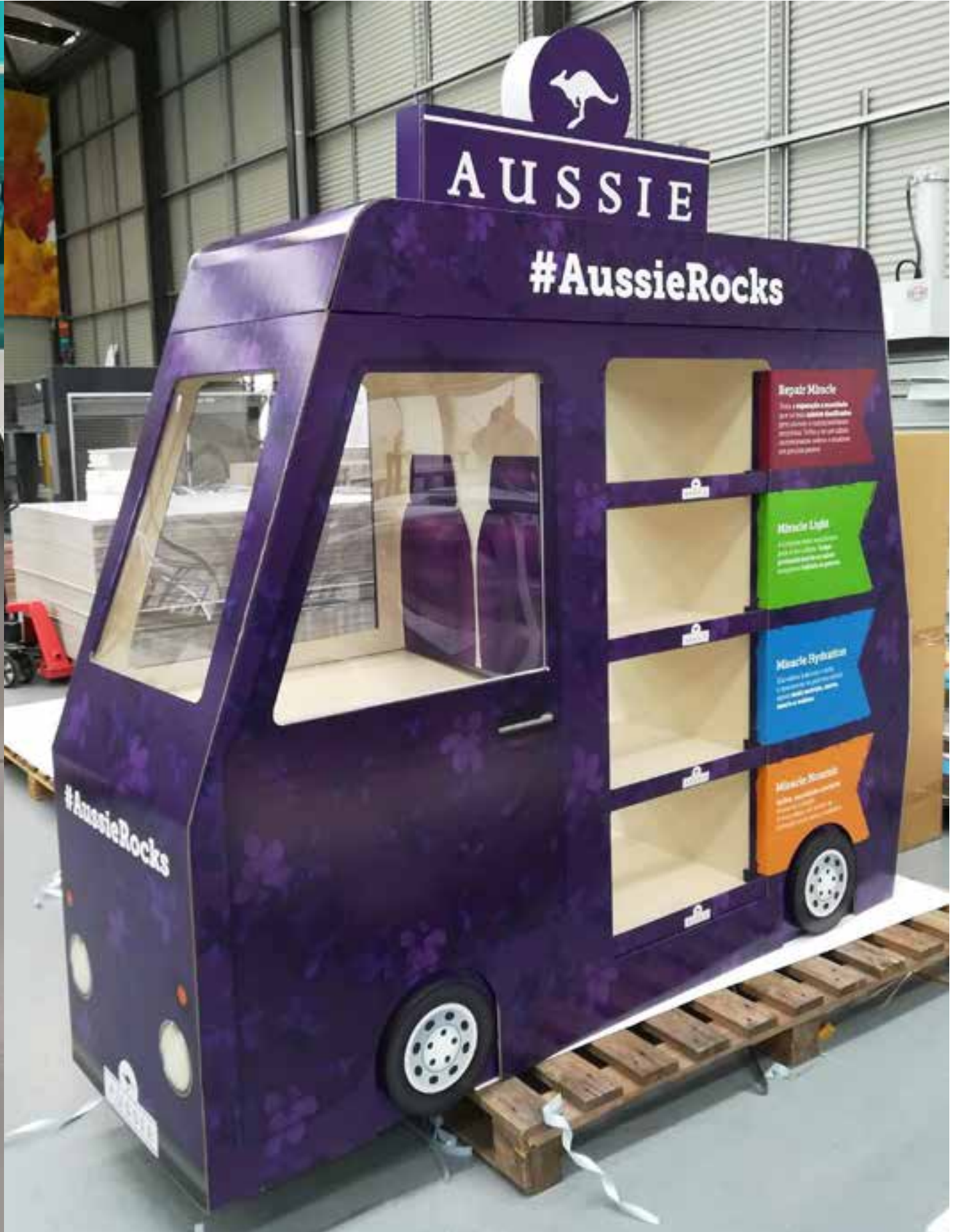
PROJETO Expositores Johnson e Aussie