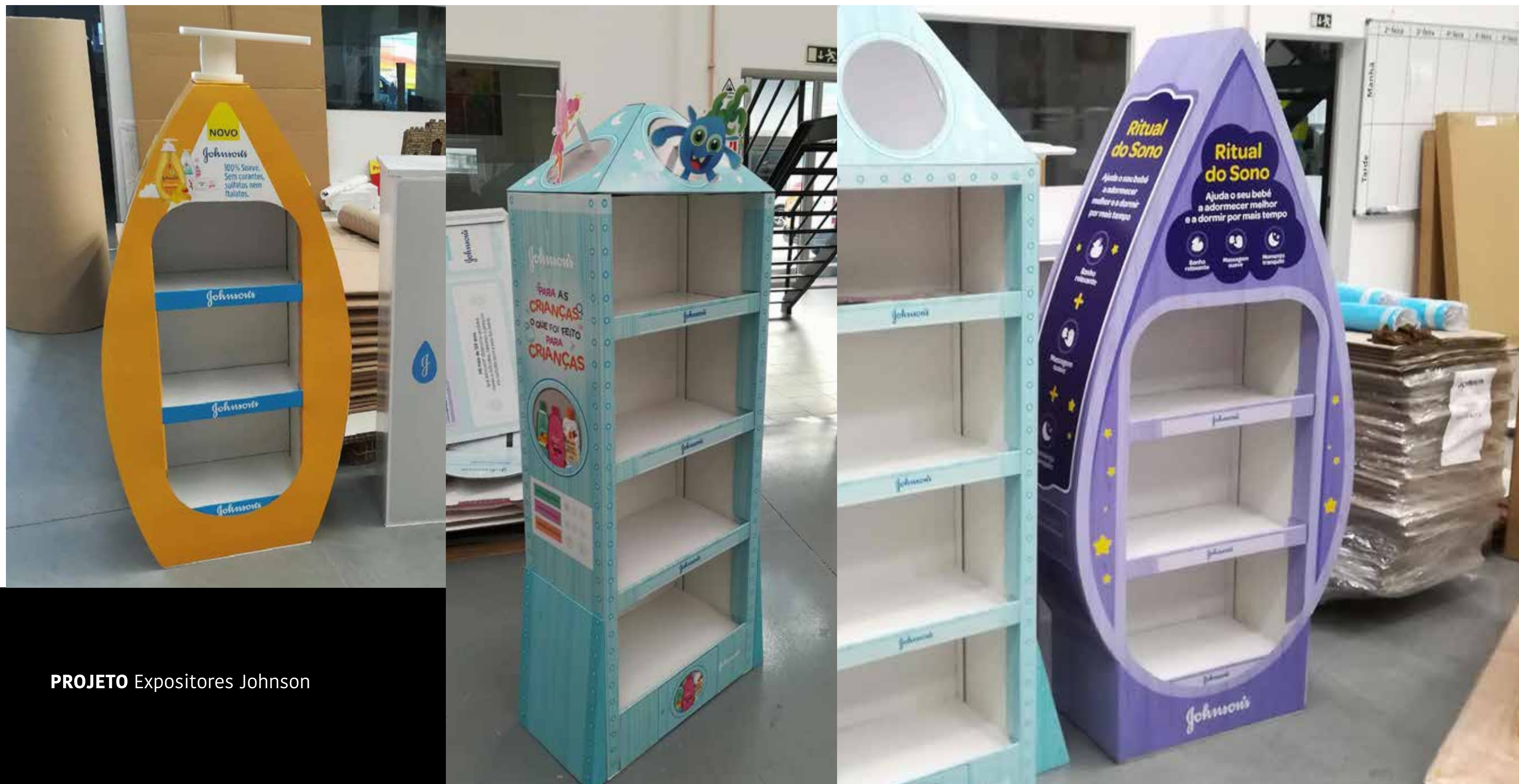
PROJETO Expositores Johnson