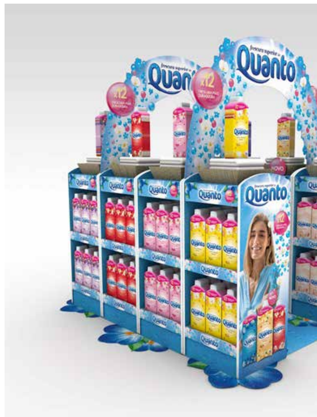
PROJETO Ilha Quanta