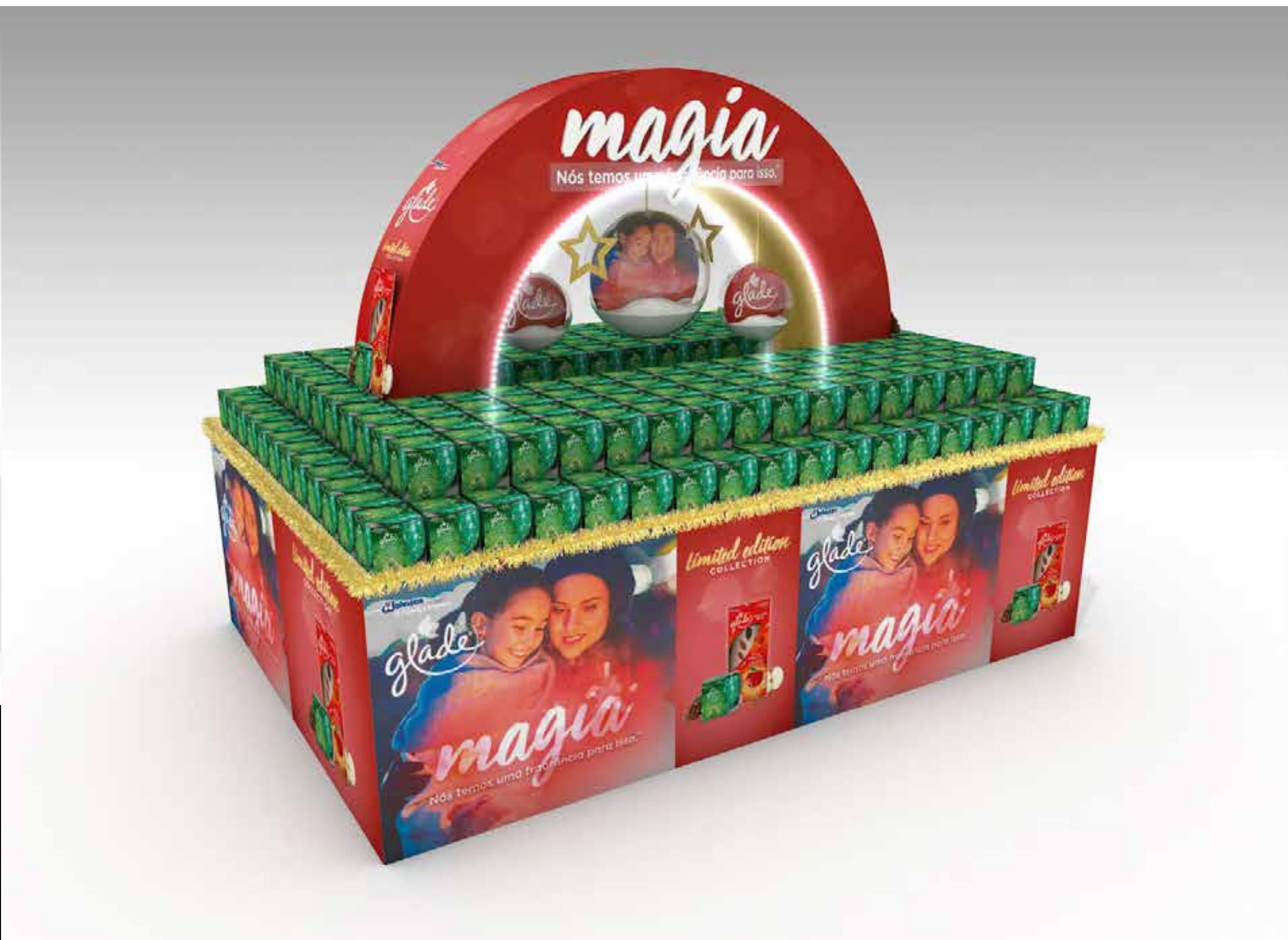
PROJETO Ilhas Glade Natal