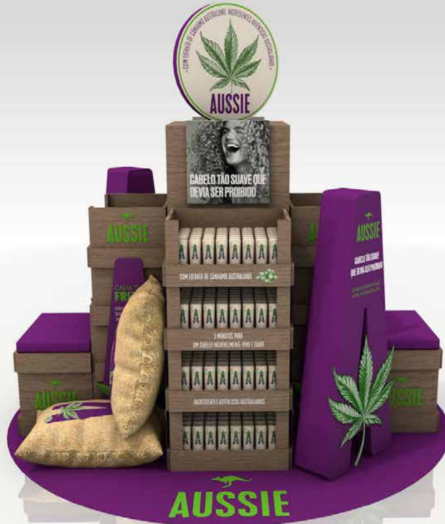
PROJETO Espaço Wow