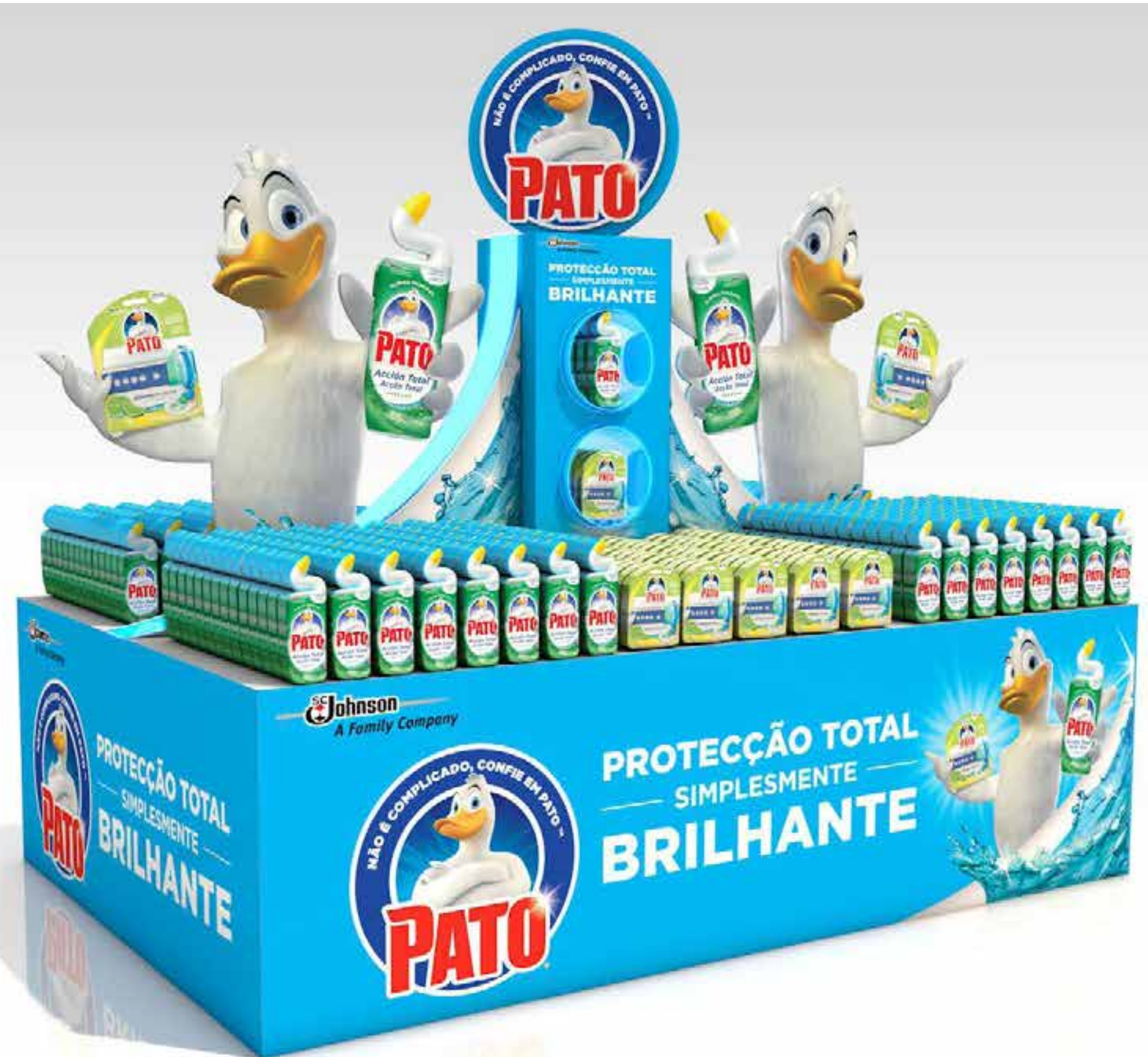
PROJETO Ilhas Pato