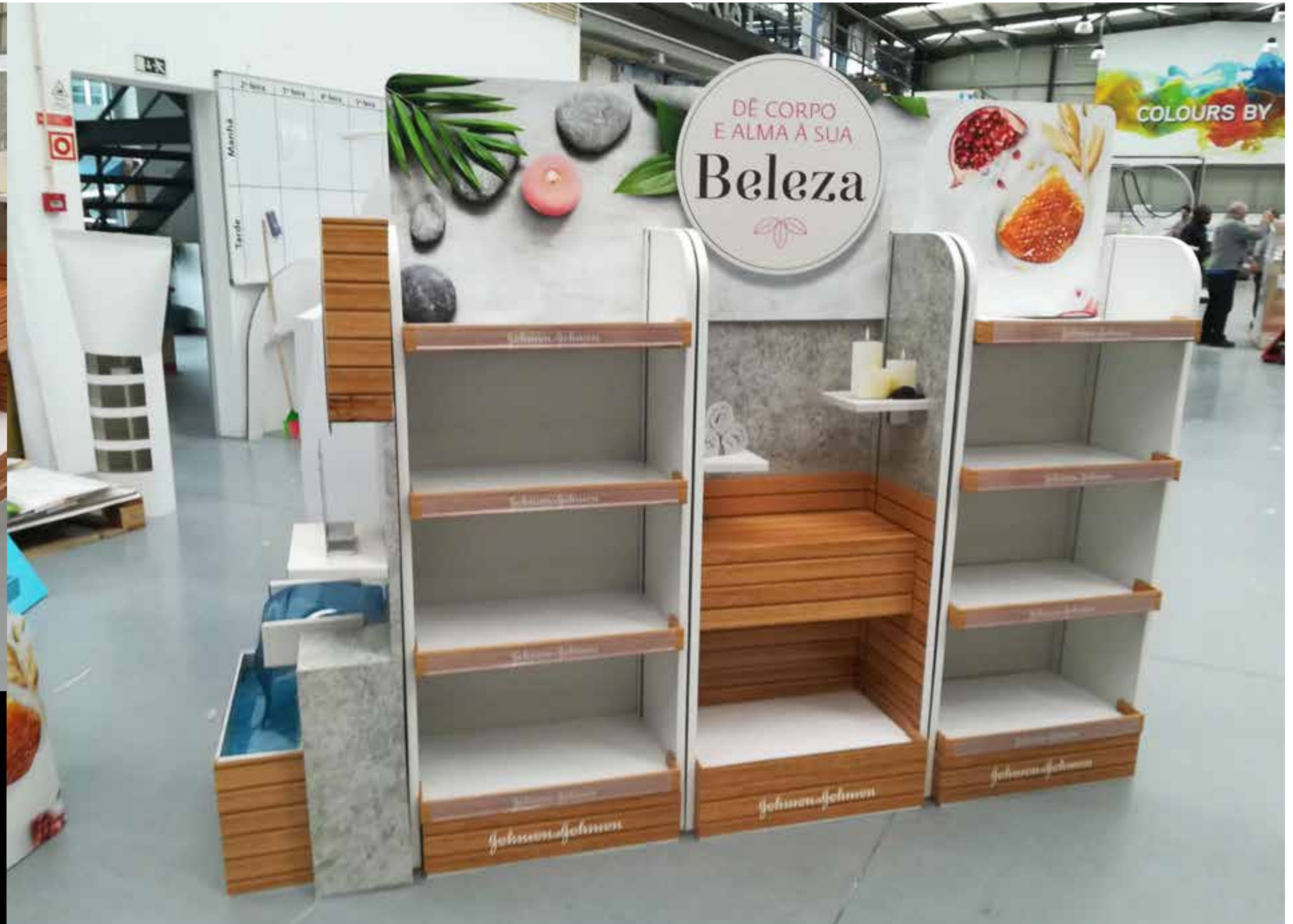
PROJETO Ilha Johnson