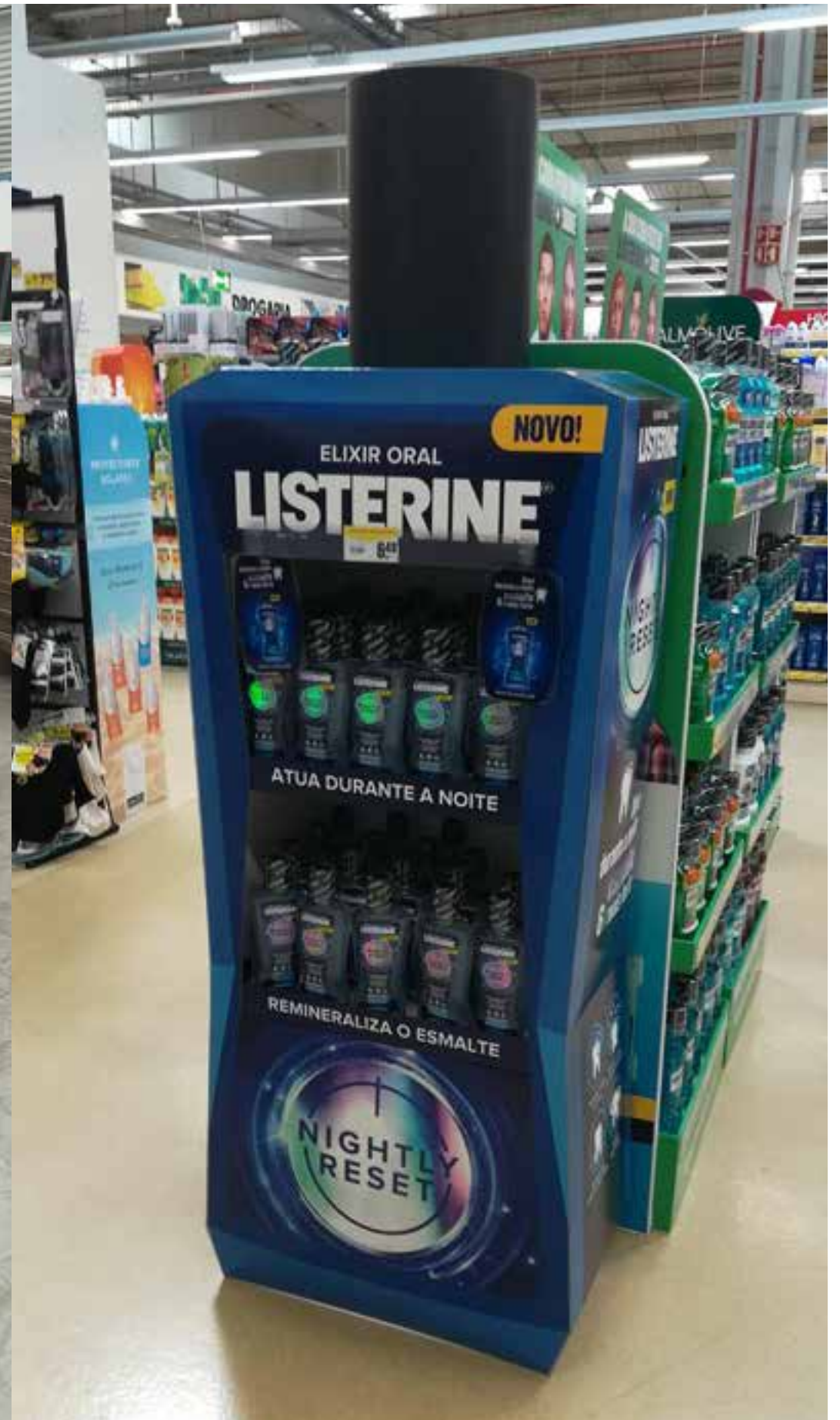
PROJETO Expositores Listerine