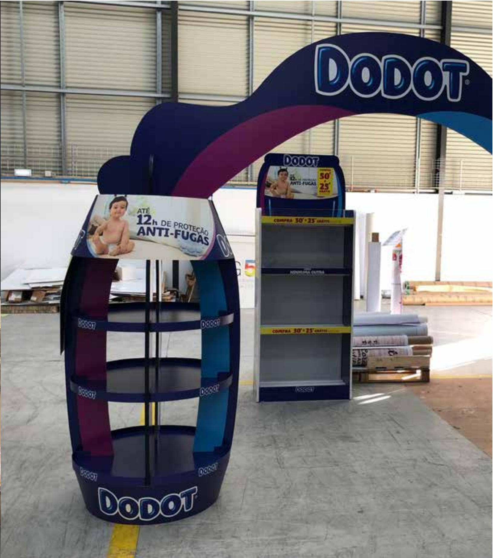
PROJETO Expositores Nestlé e Dodot