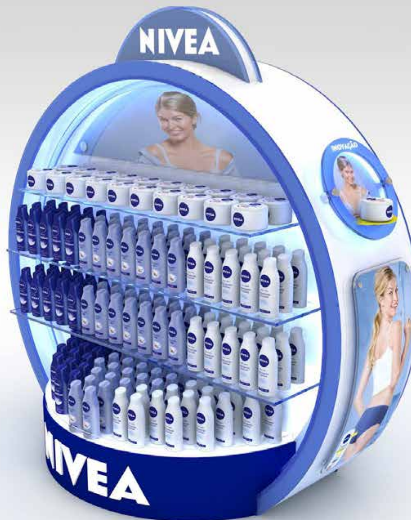
PROJETO Expositores Nivea