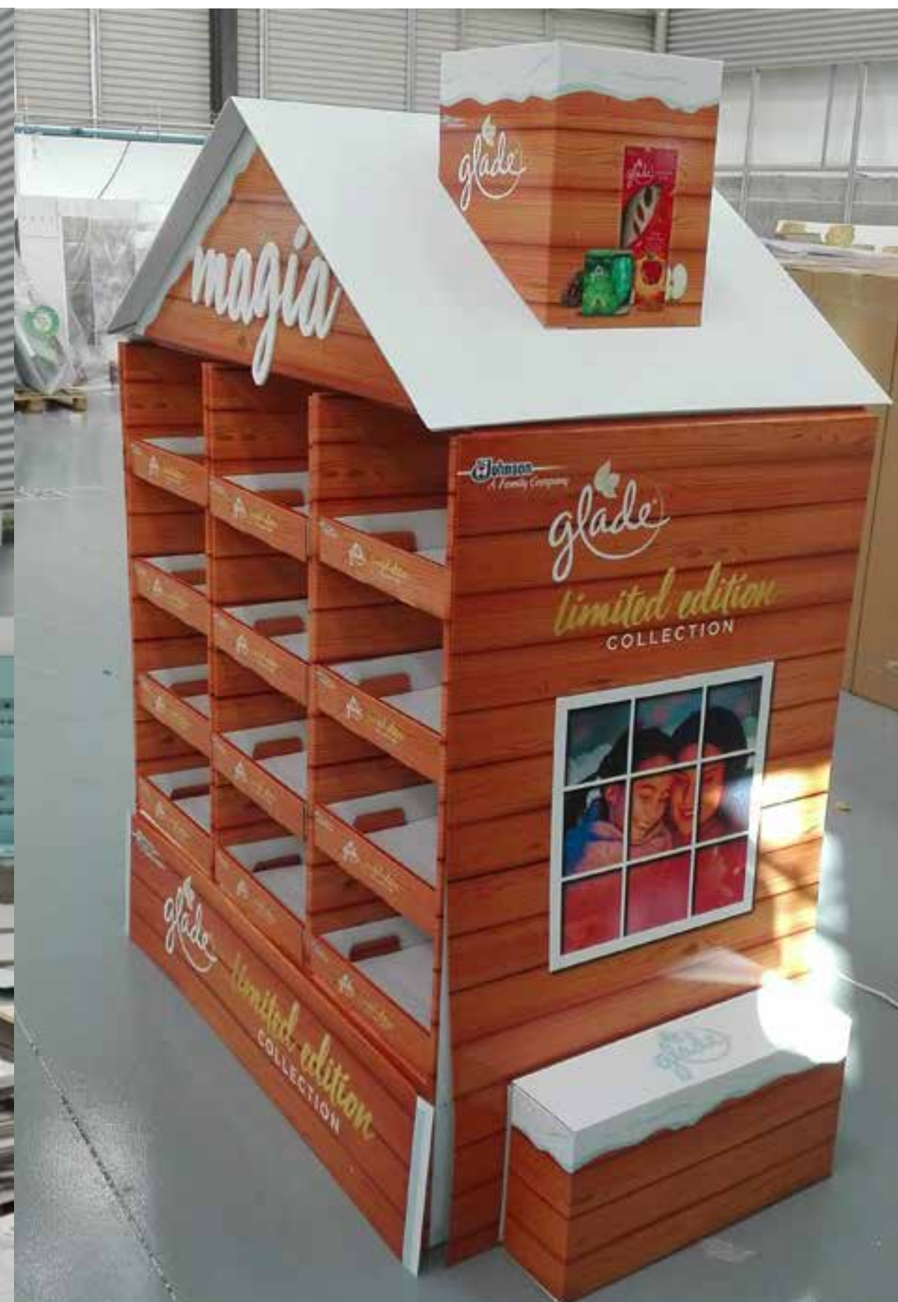
PROJETO Expositor Dodot e Peças Natal Glade