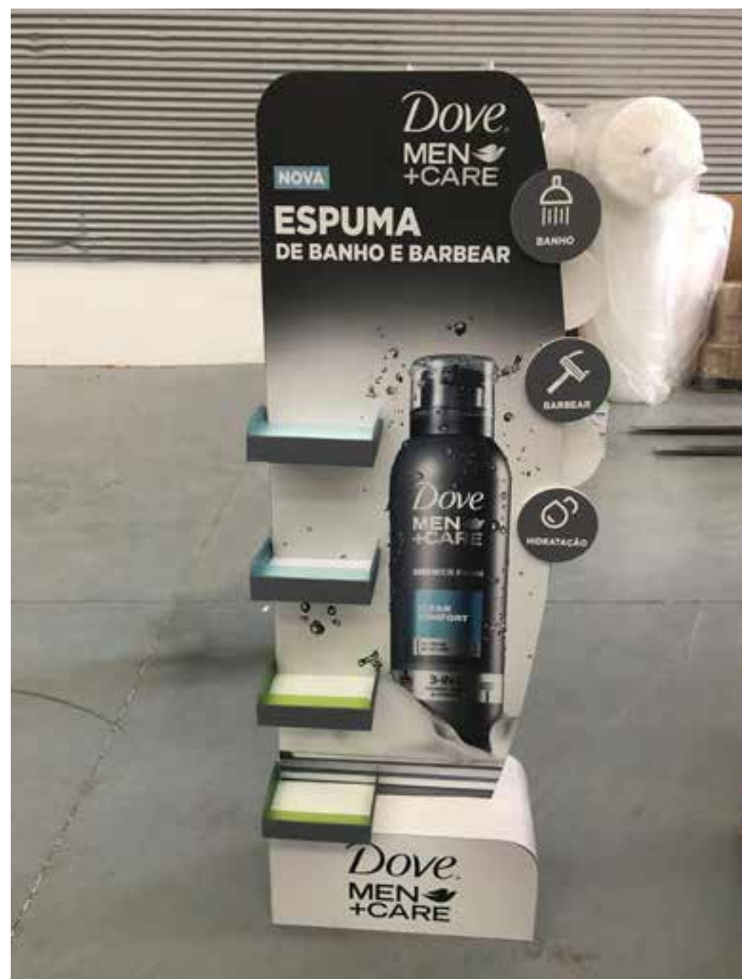
PROJETO Expositor Dove e Stand Periquita