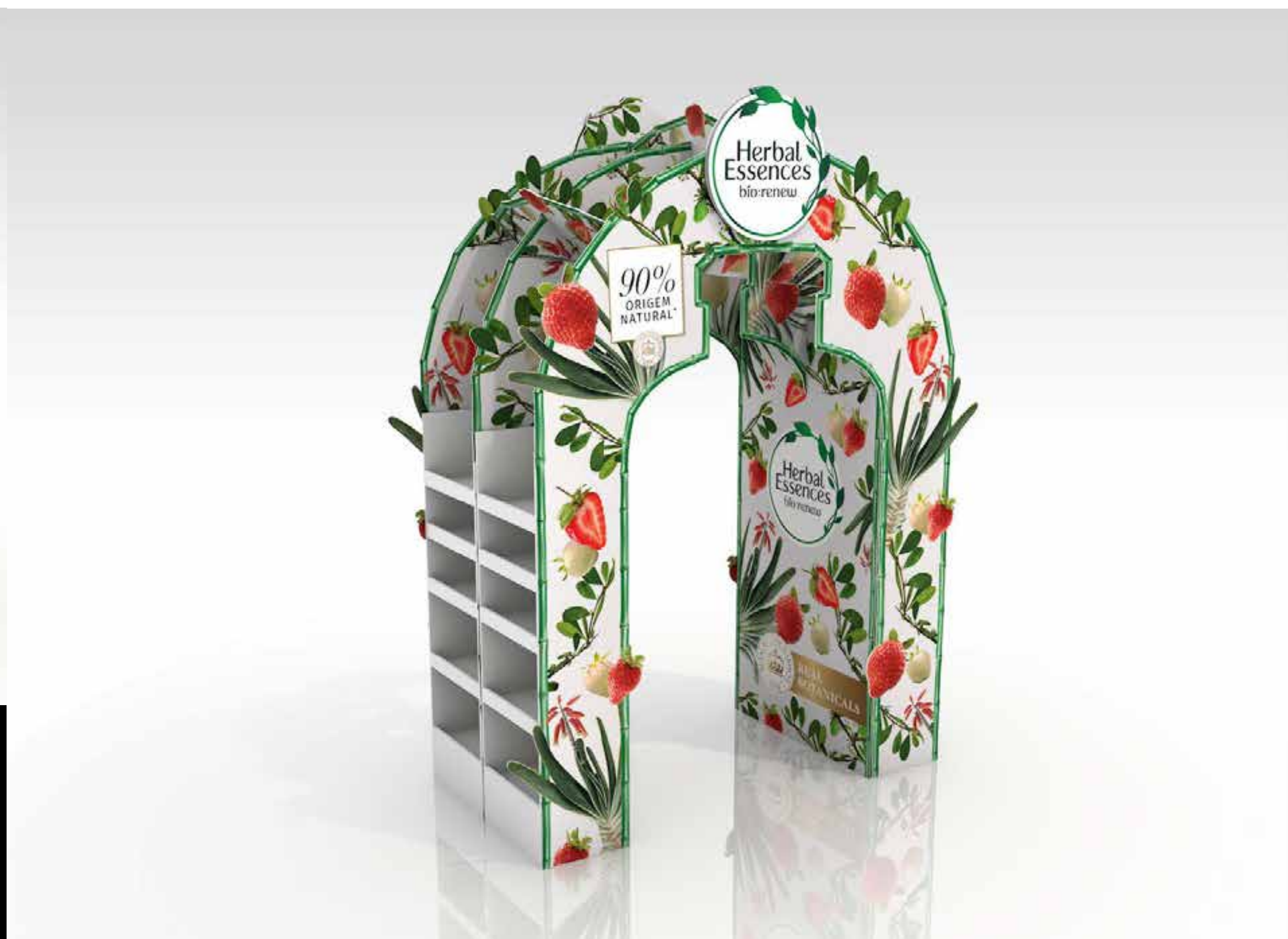
PROJETO Pórtico Expositores Herbal Essences