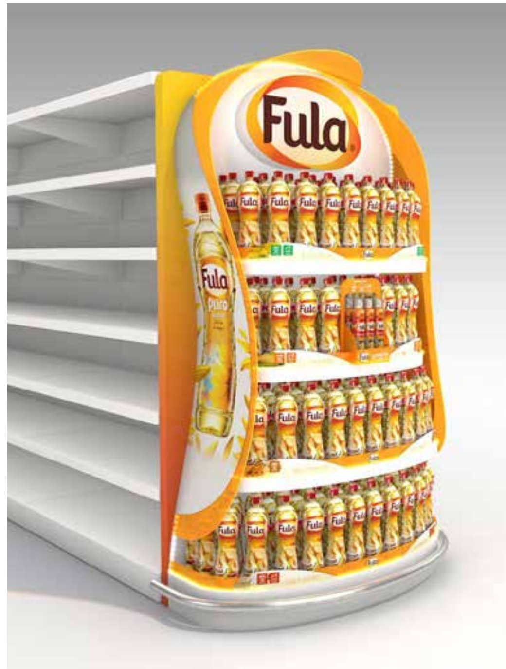
PROJETO Expositor Permanente Fula