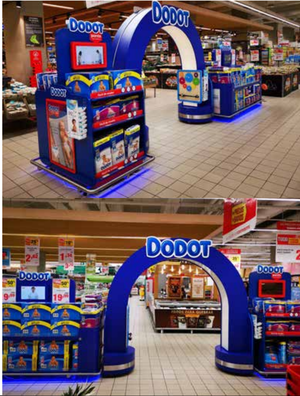
PROJETO Pórtico e Ilha Dodot