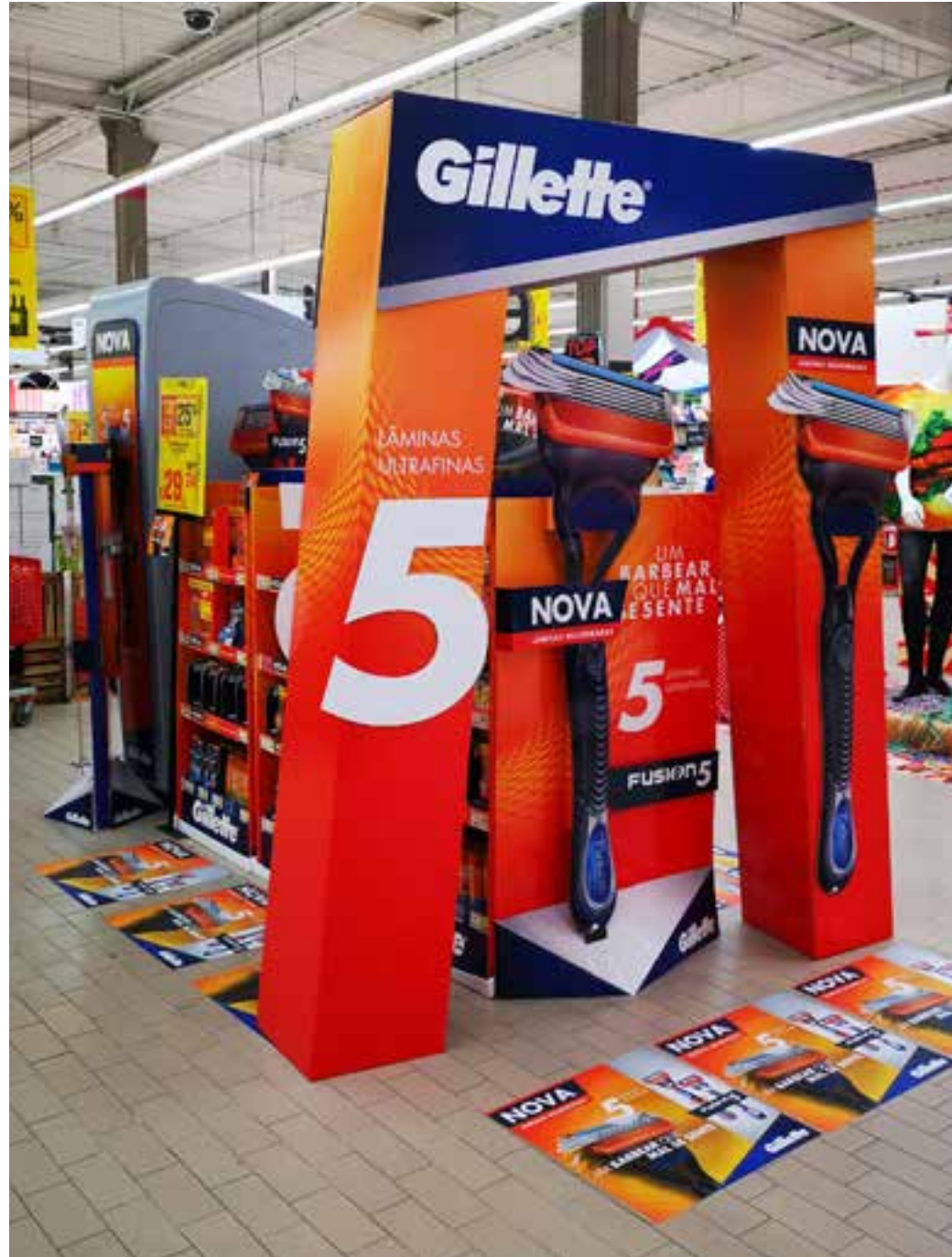
PROJETO Ilha Gillette