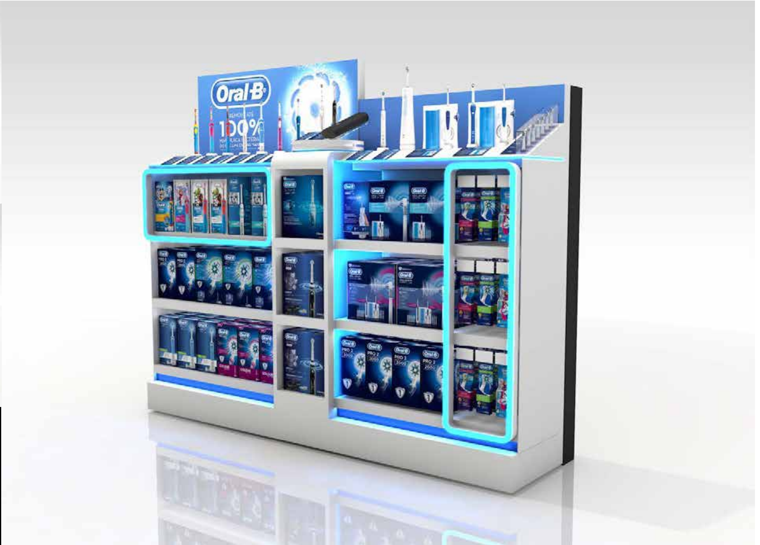
PROJETO Oral B Worten Cascais