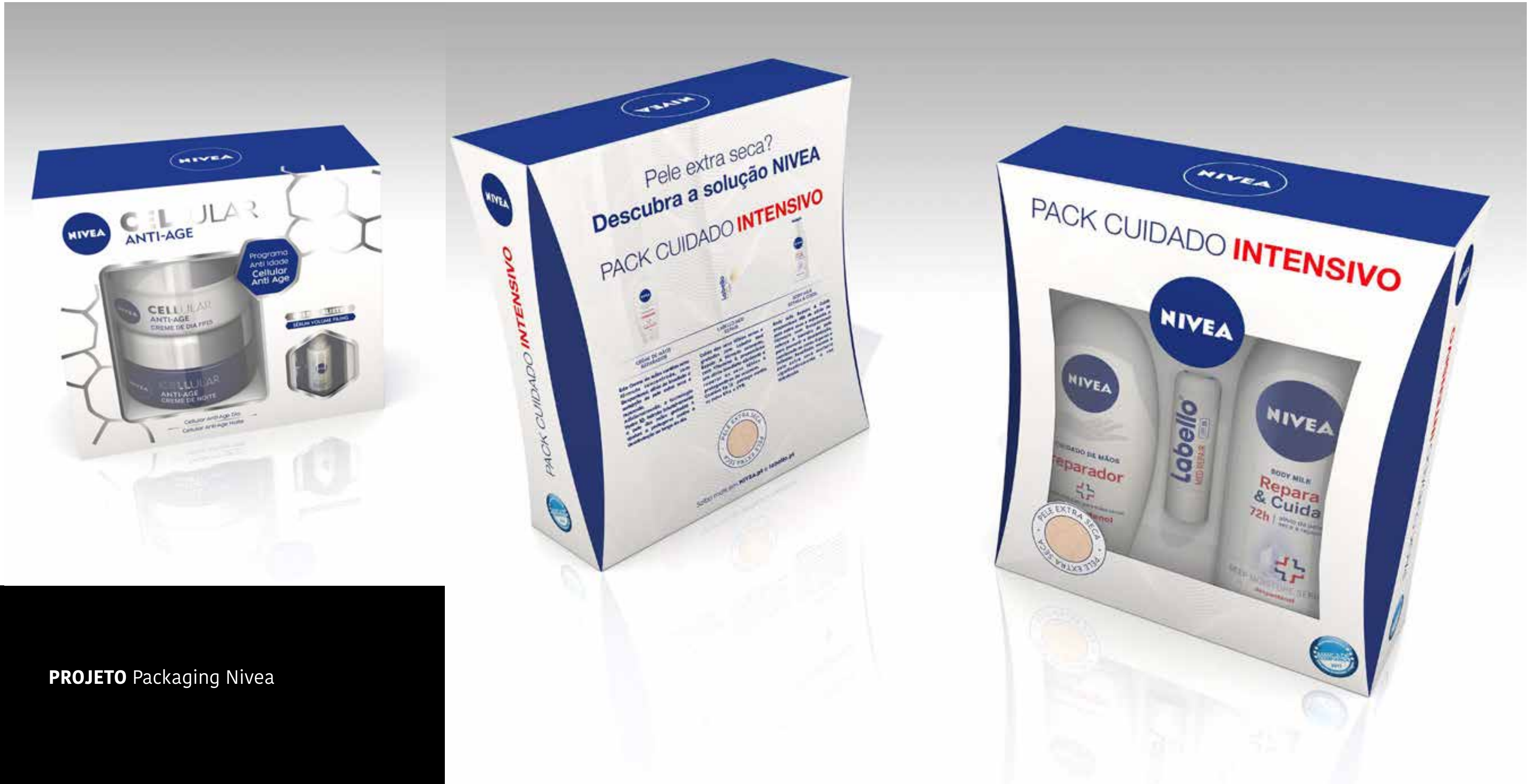
PROJETO Packaging Nivea