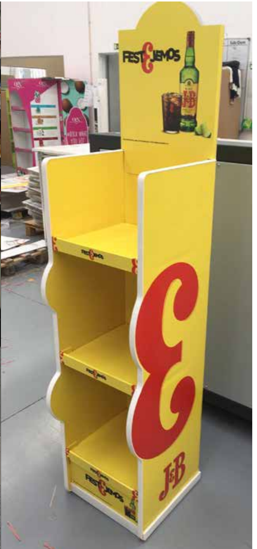
PROJECTO Expositores vários