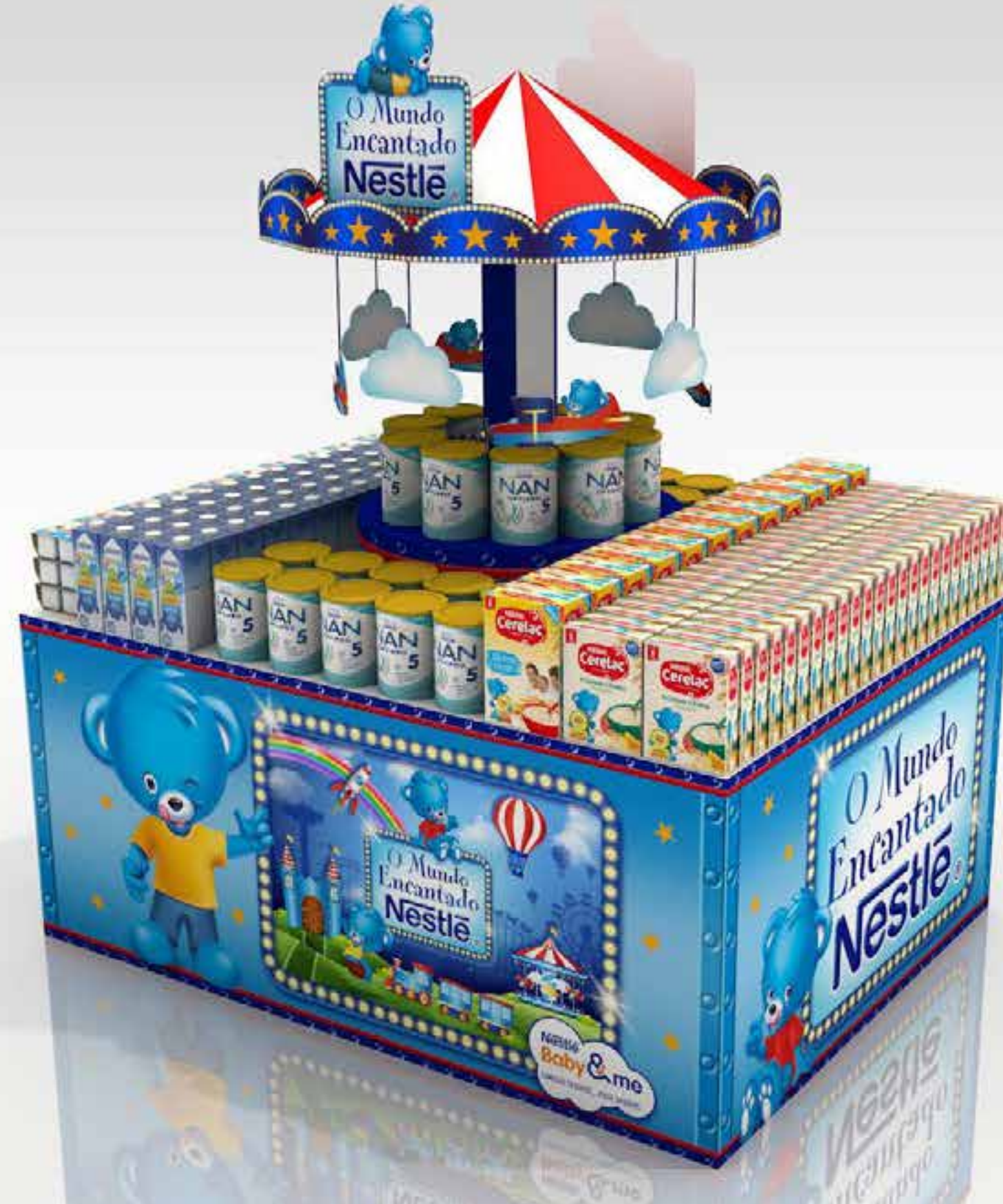
PROJETO Nestlé Feira do Bebê