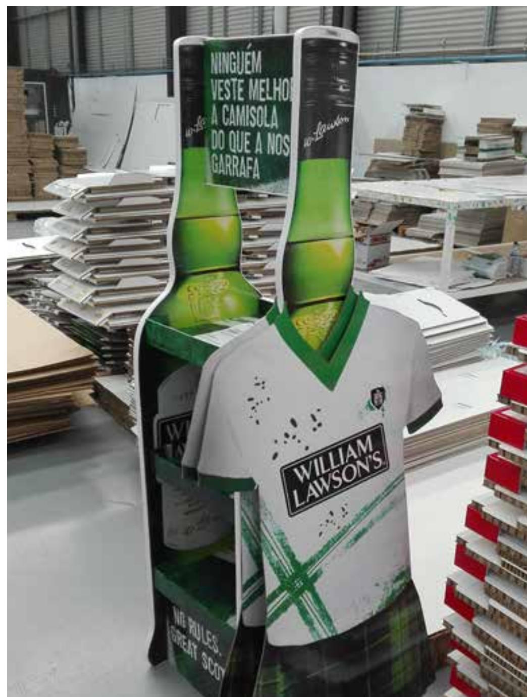
PROJETO Expositores William Lawsons e Martini + Bancada Martini