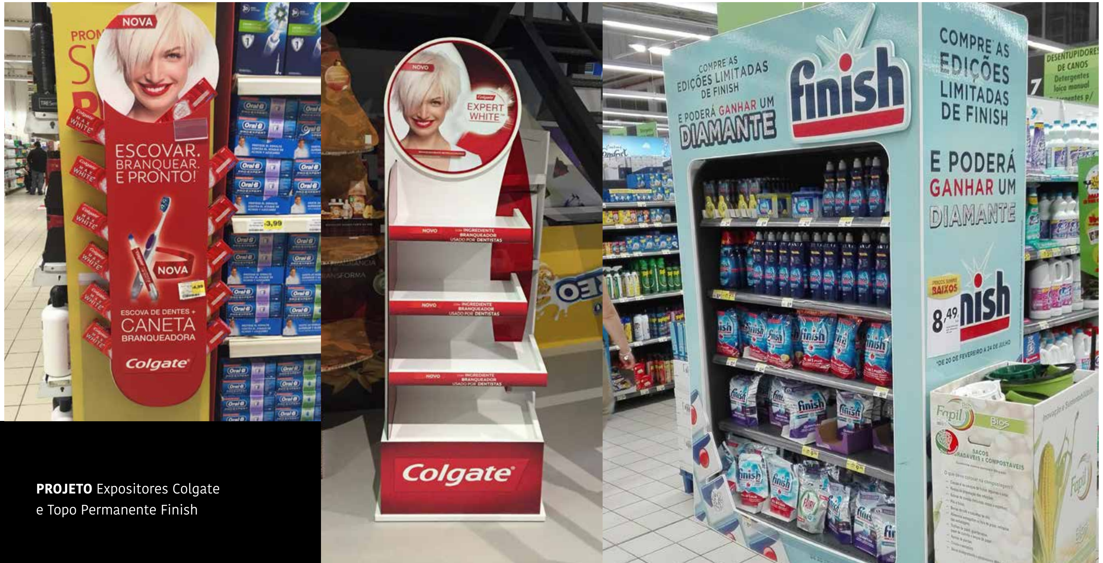
PROJETO Expositores Colgate e Topo Permanente Finish