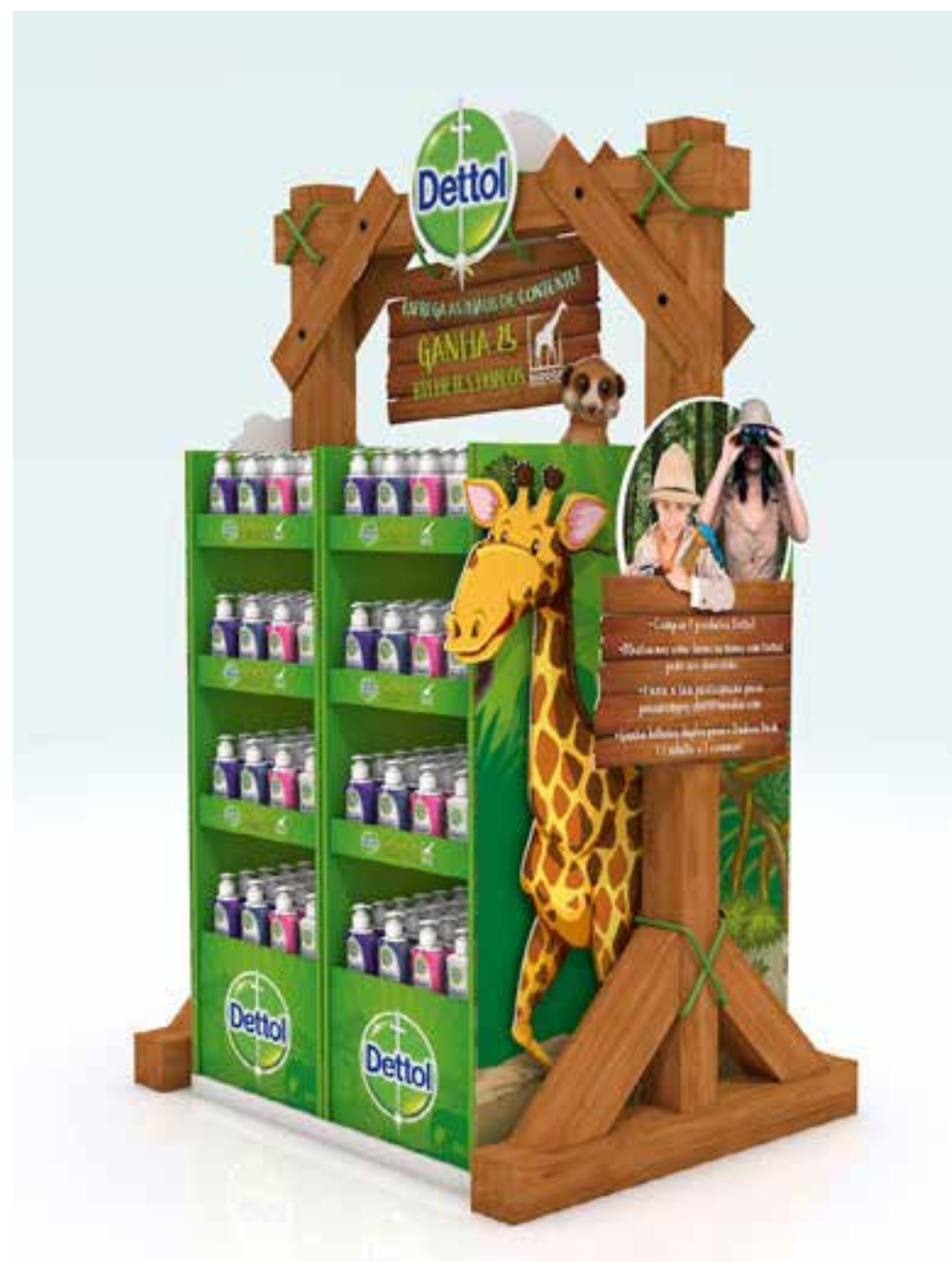
PROJETO Ilhas Expositores Dettol e Veet