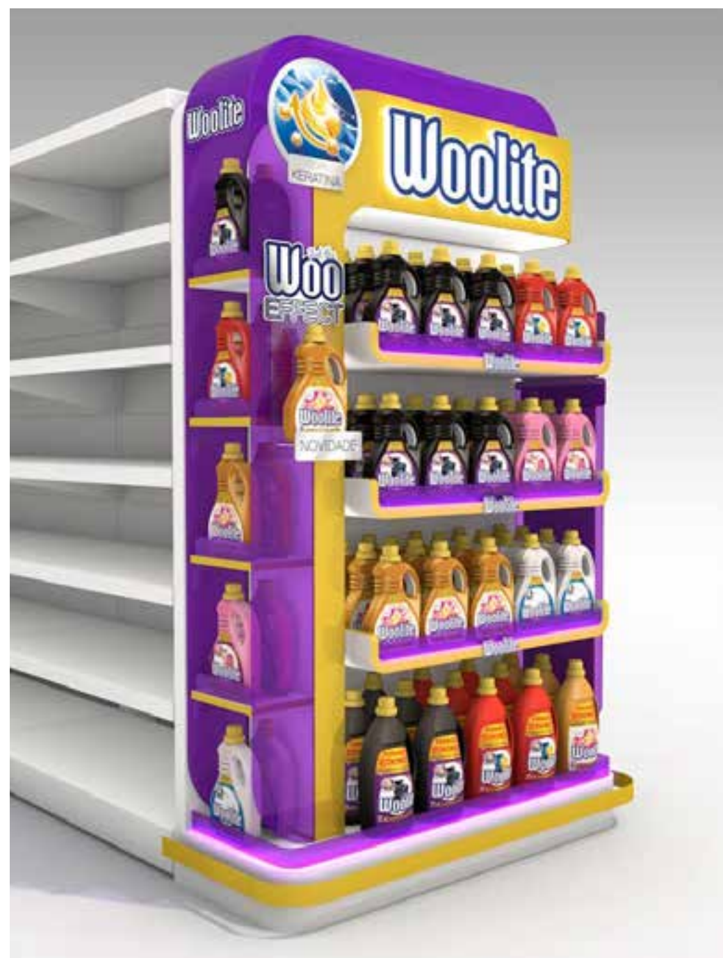
PROJETO Expositores Permanentes