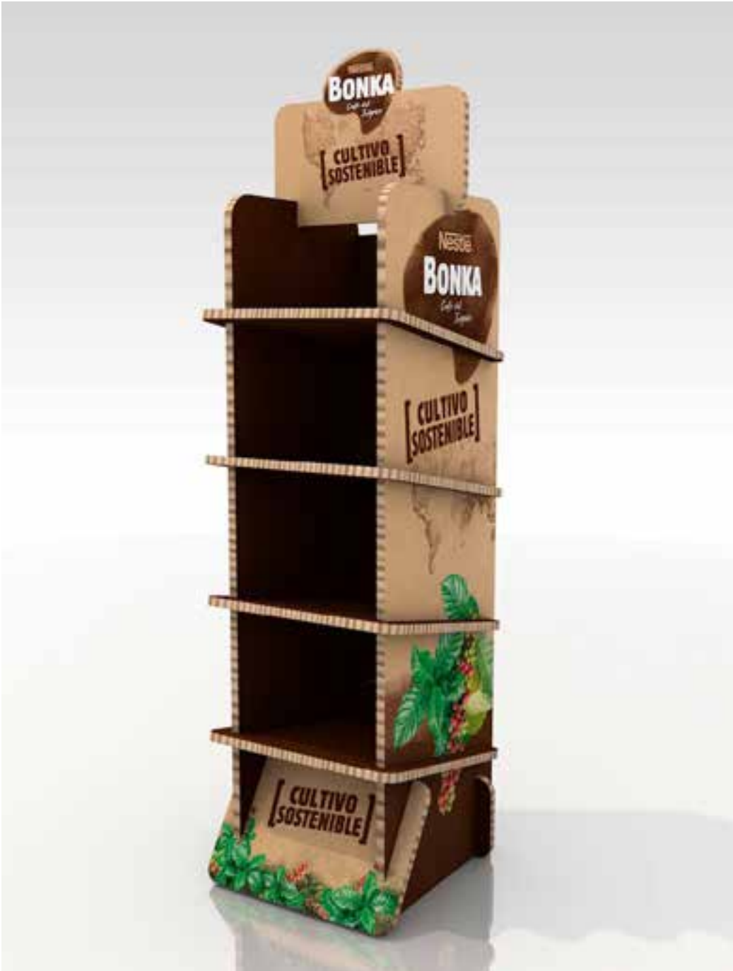
PROJETO Expositores Espanha