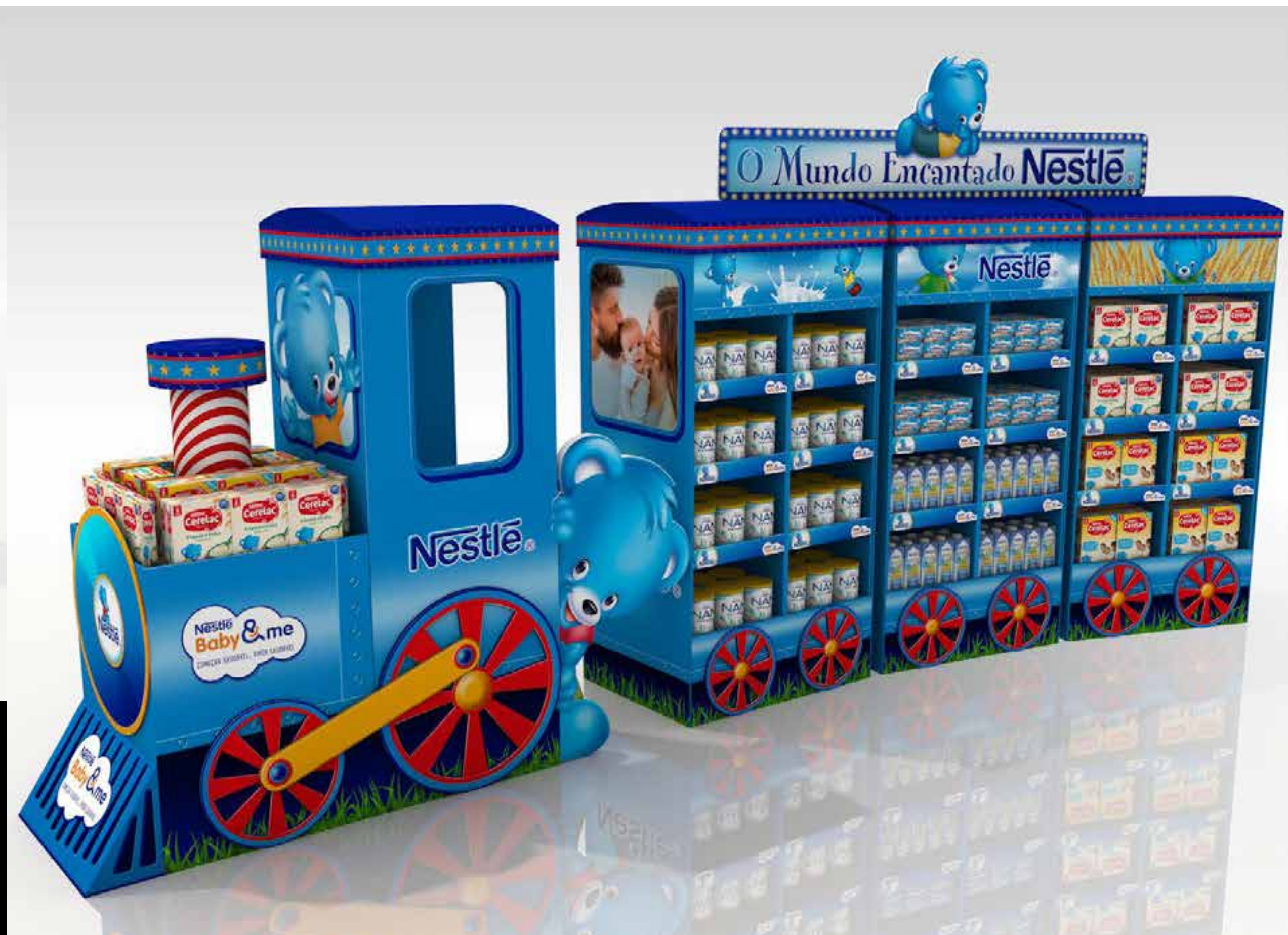
PROJETO Nestlé Feira do Bebê