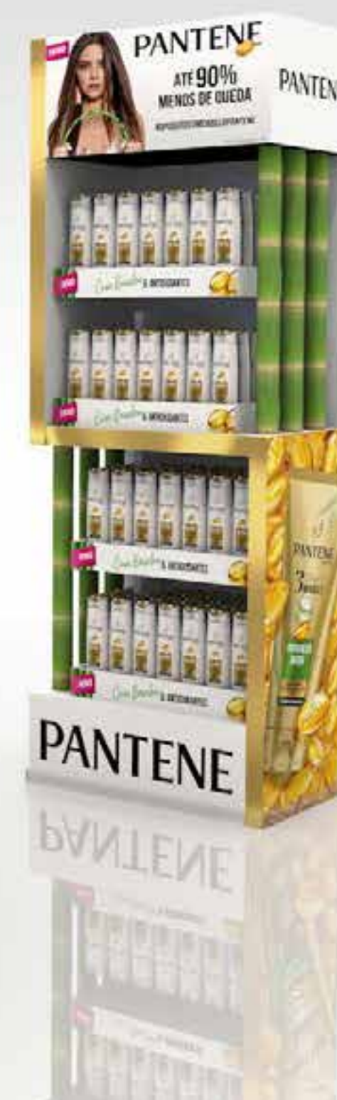
PROJETO Expositores Espanha e Portugal