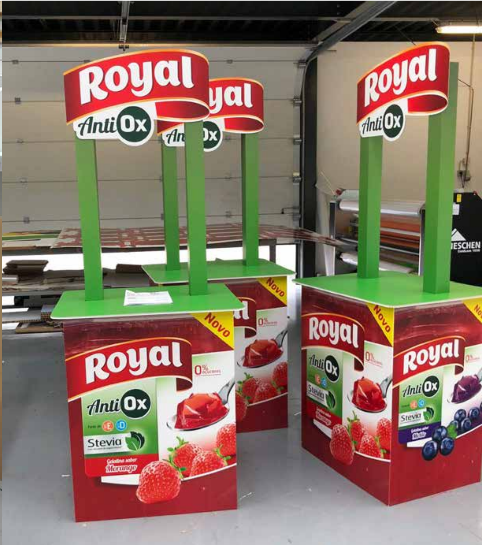
PROJETO Expositor e Bancas Royal