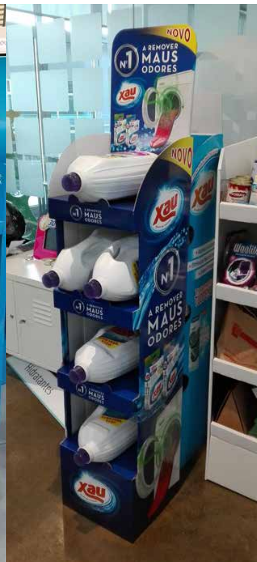
PROJETO Expositores Vários