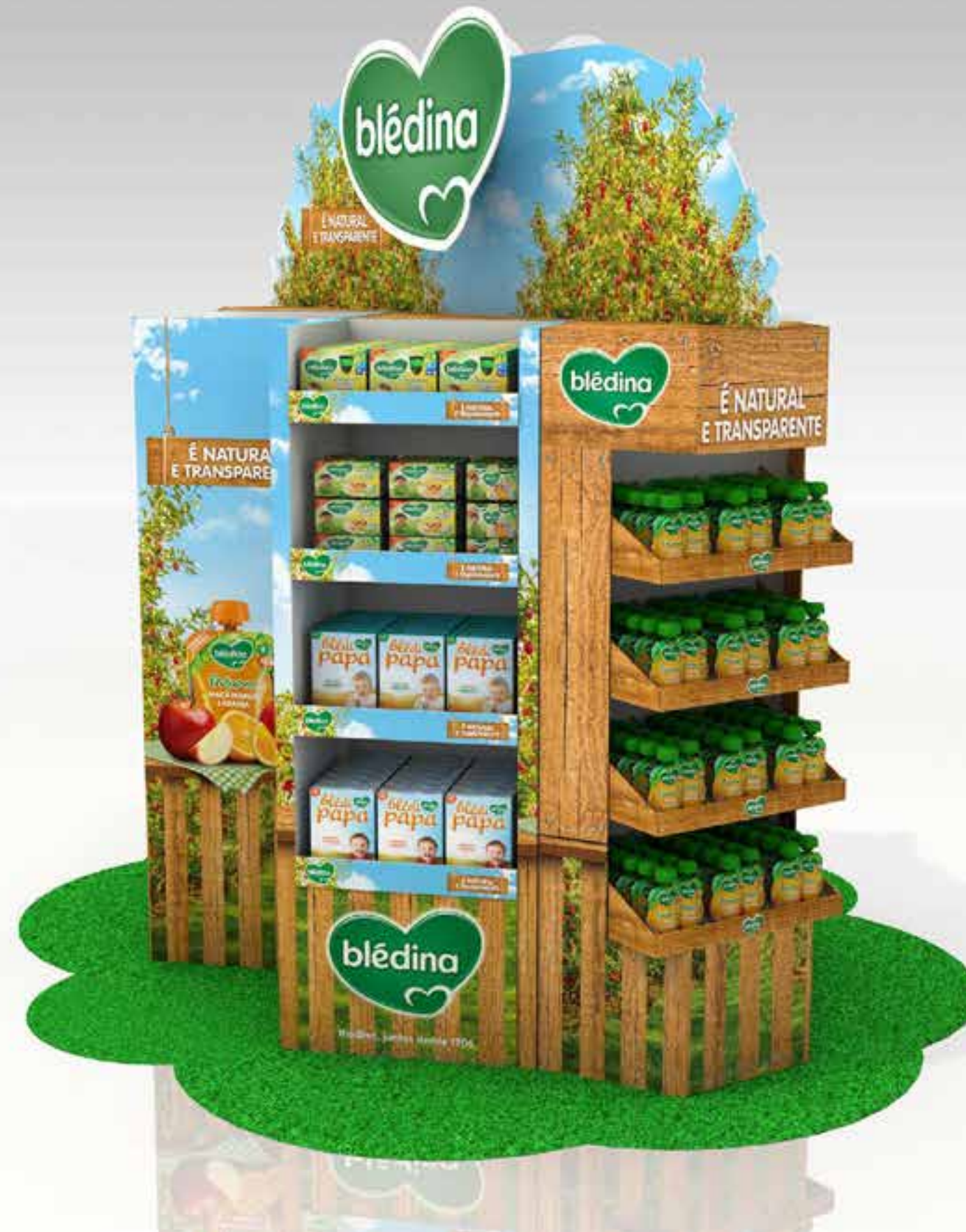
PROJETO Feira do Bebê Blédina_Exposito e Ilha