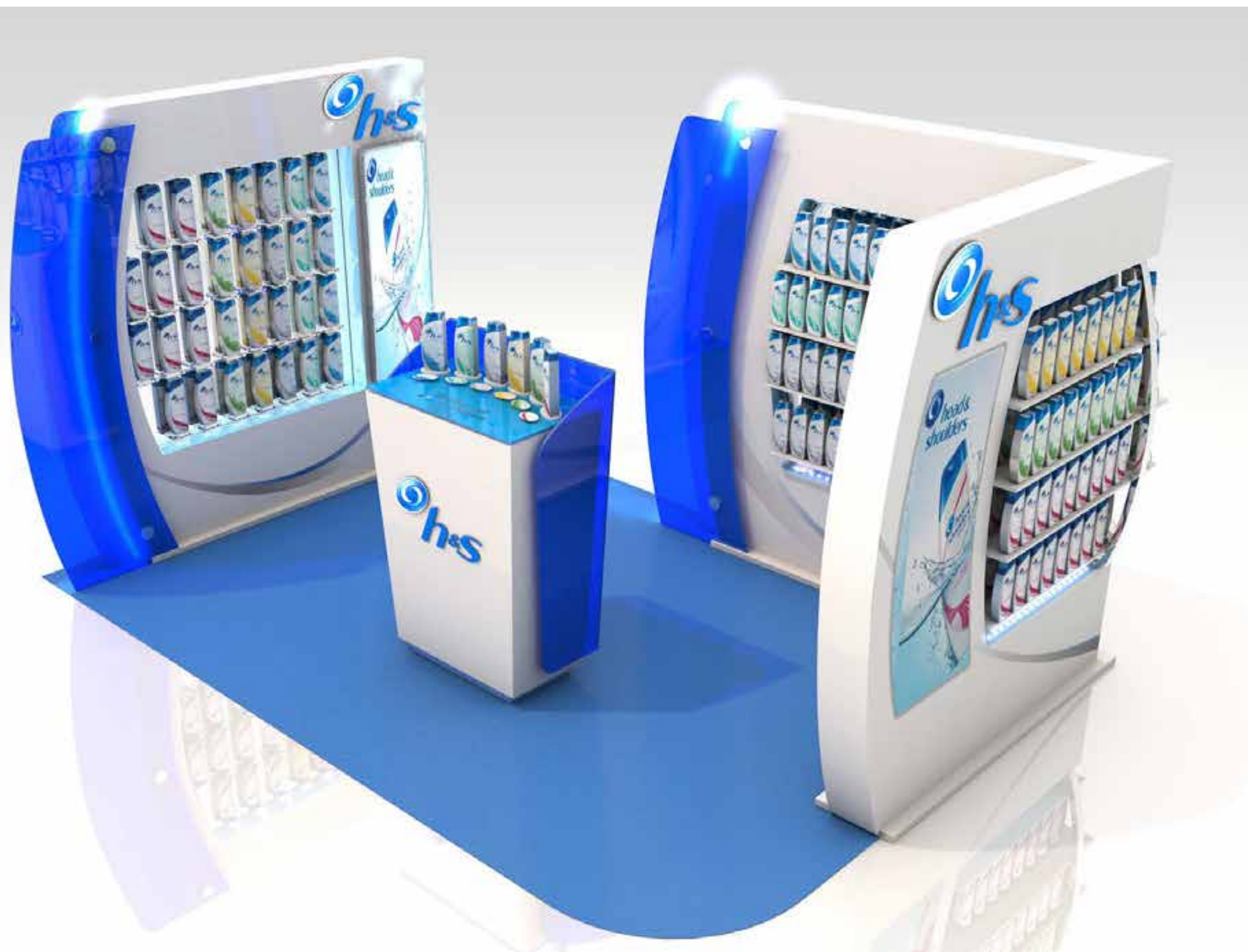
PROJETO Linear e Espaço H&S