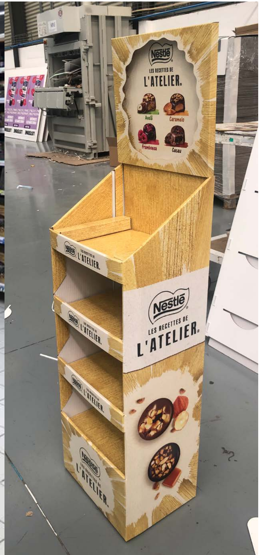
PROJECTO Campanha Nestlé Natal