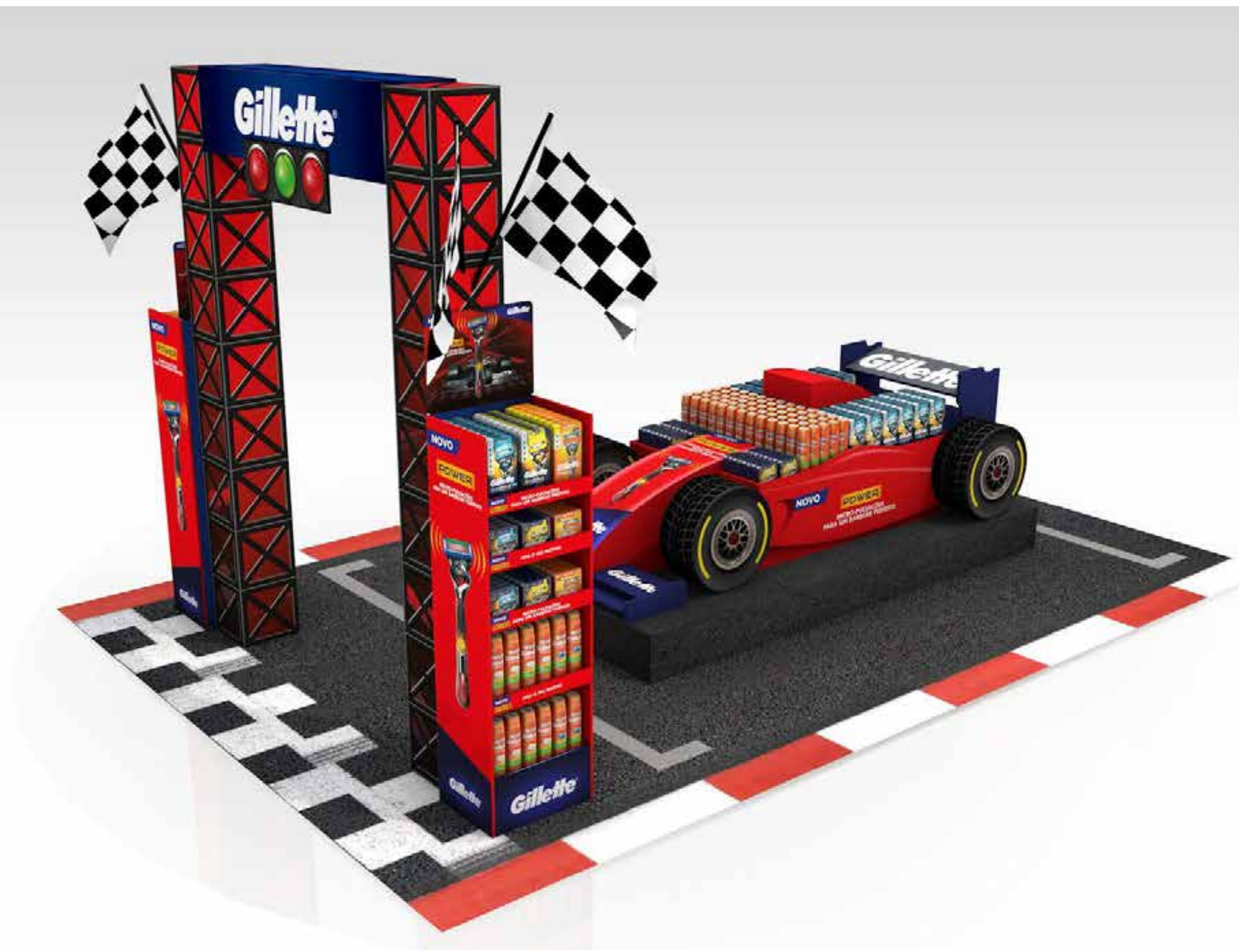
PROJETO Espaço Gillette