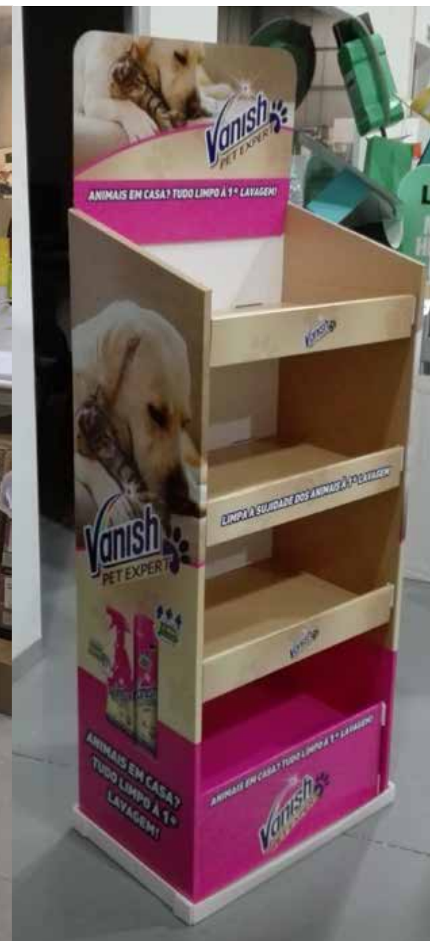
PROJETO Peças Natal Finish e Lipton e Expositor Vanish Pet