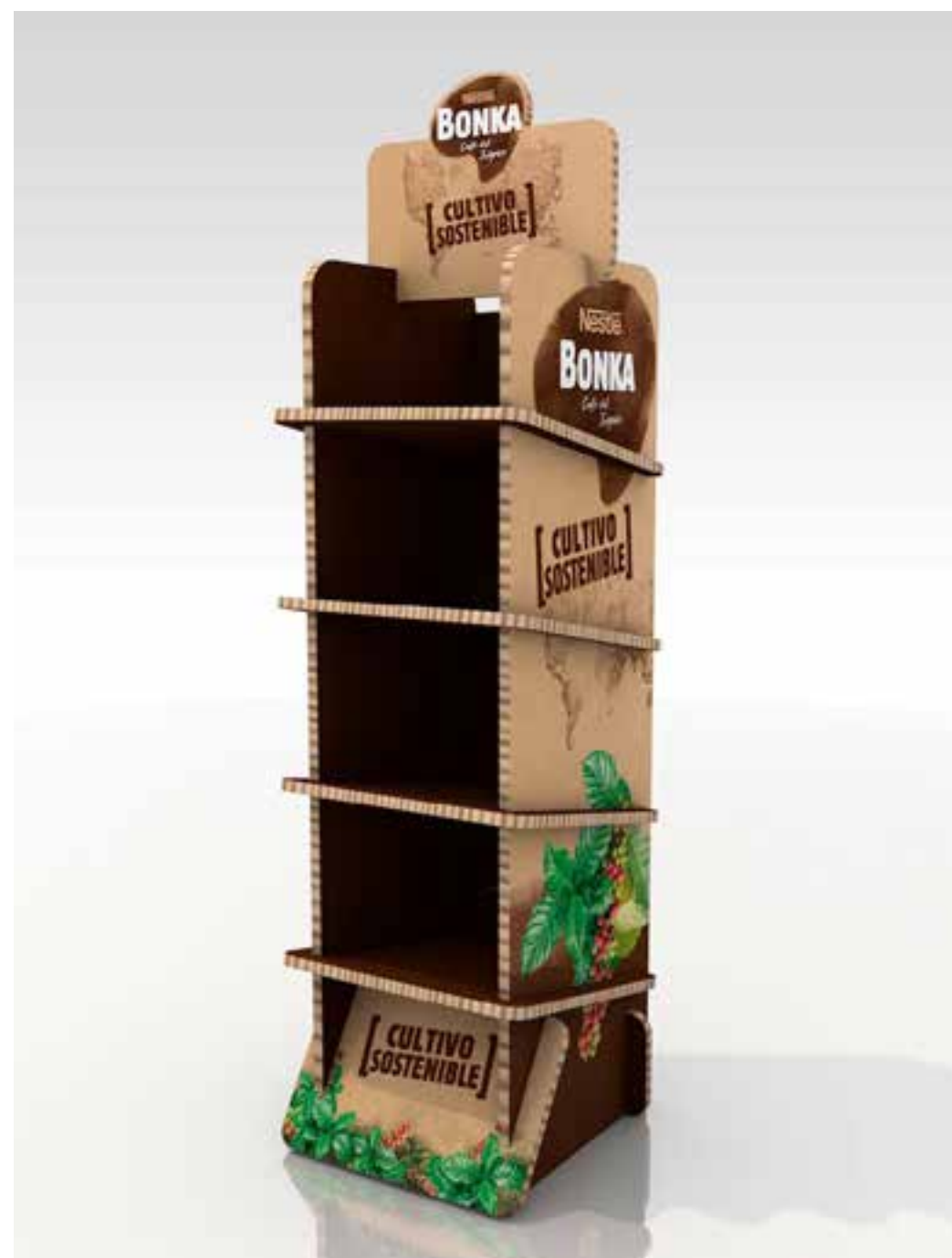
PROJETO Expositores e Espaços Vários