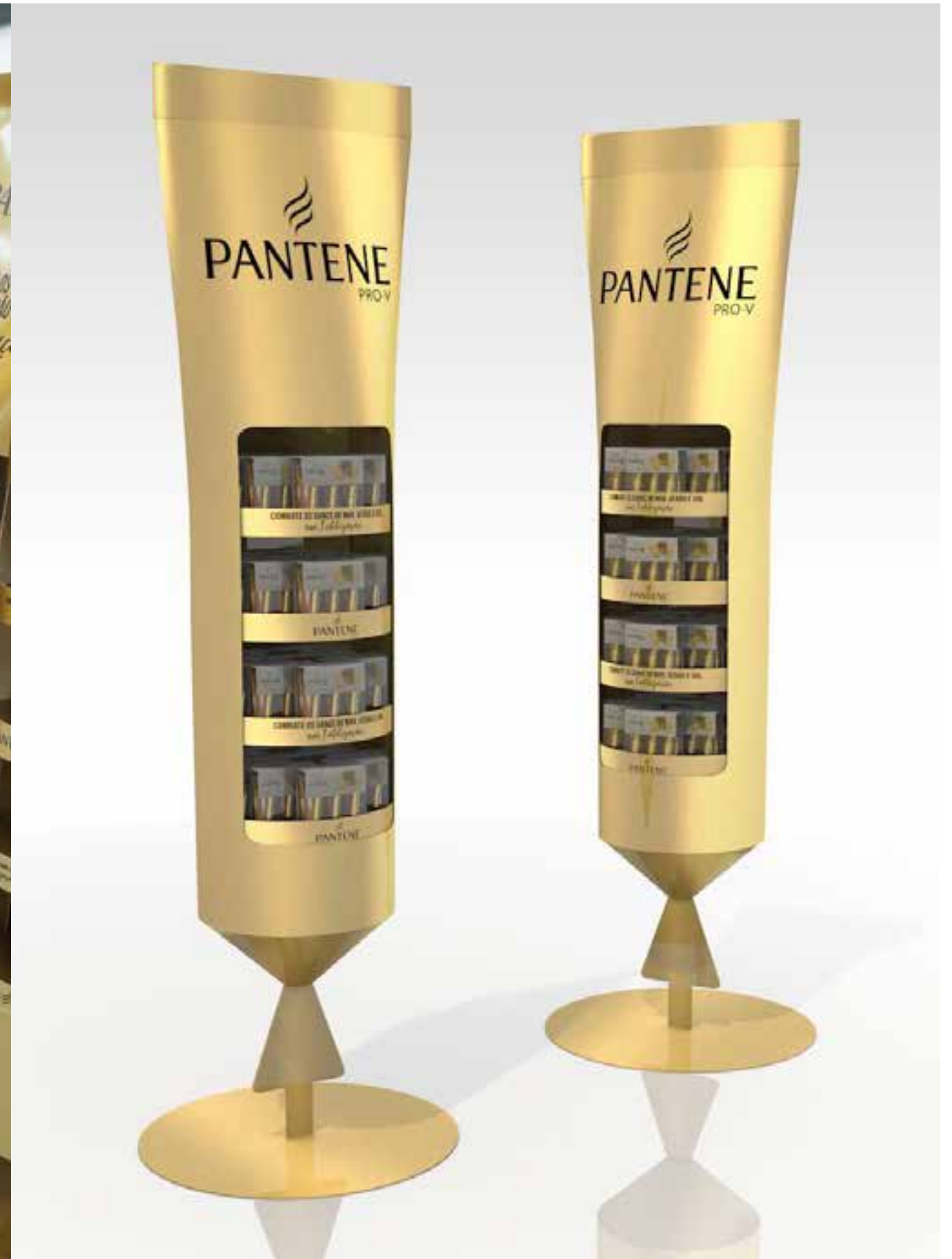
PROJETO Expositores Pantene