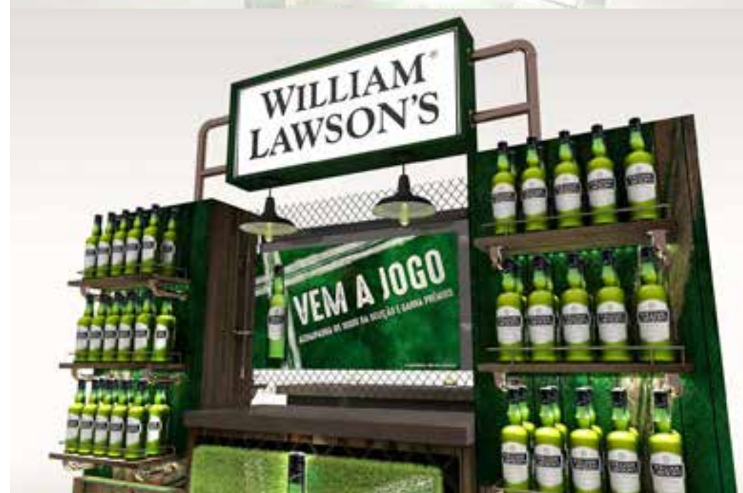
PROJETO Bar William Lawsons