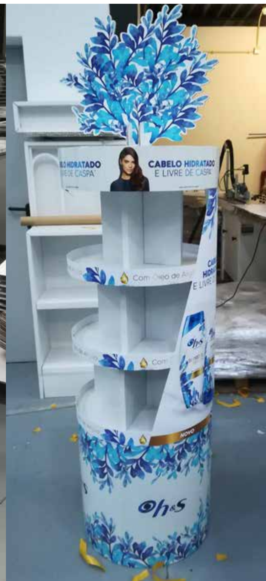
PROJETO Ilhas Ogx e H&S