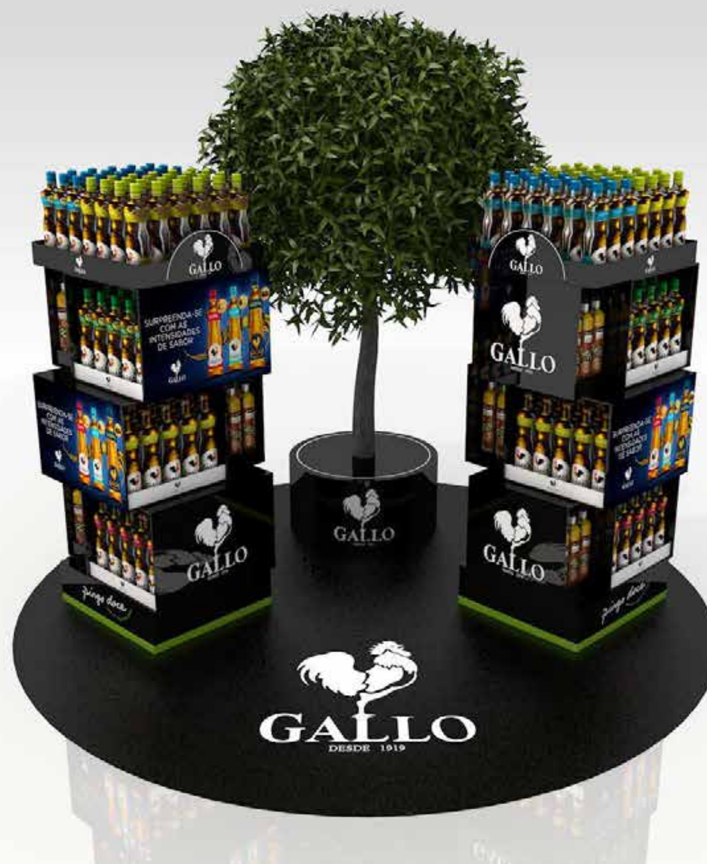
PROJETO Expositores e Ilha Gallo